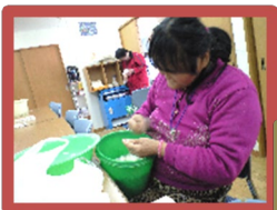
一、紙パックの材料をちぎって、