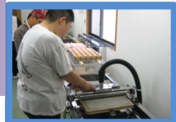
四、水気をしっかりと取り、