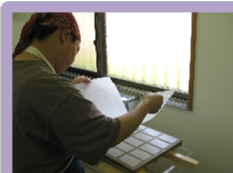
三、慎重に枠を外し不織布をつけて、