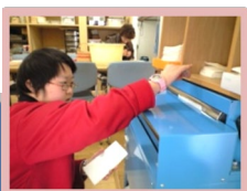
五、圧縮してきれいに仕上げます。

お店のショップカードなどにも、いかがですか？ デザイン・数量など、ご相談下さい！